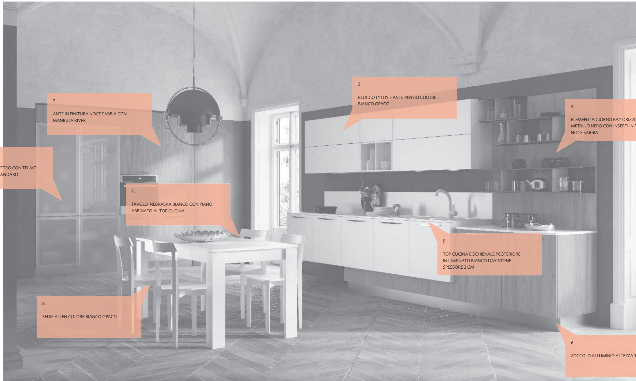
1. COLONNA CON ANTE VETRO CON TELAIO ALLUMINIO E VETRO STANDARD