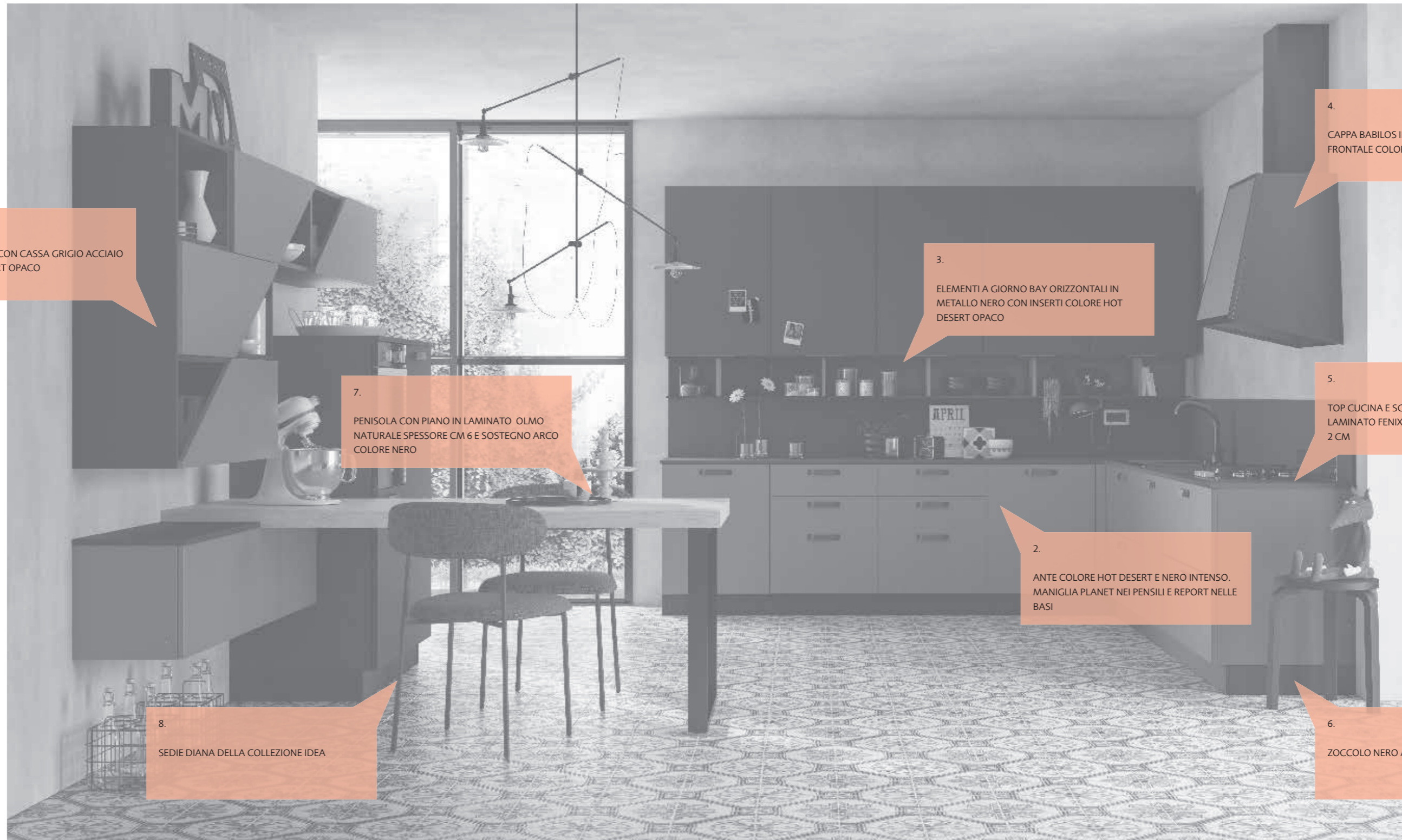
1. PENSILI TRAPEZIO CON CASSA GRIGIO ACCIAIO E ANTE HOT DESERT OPACO