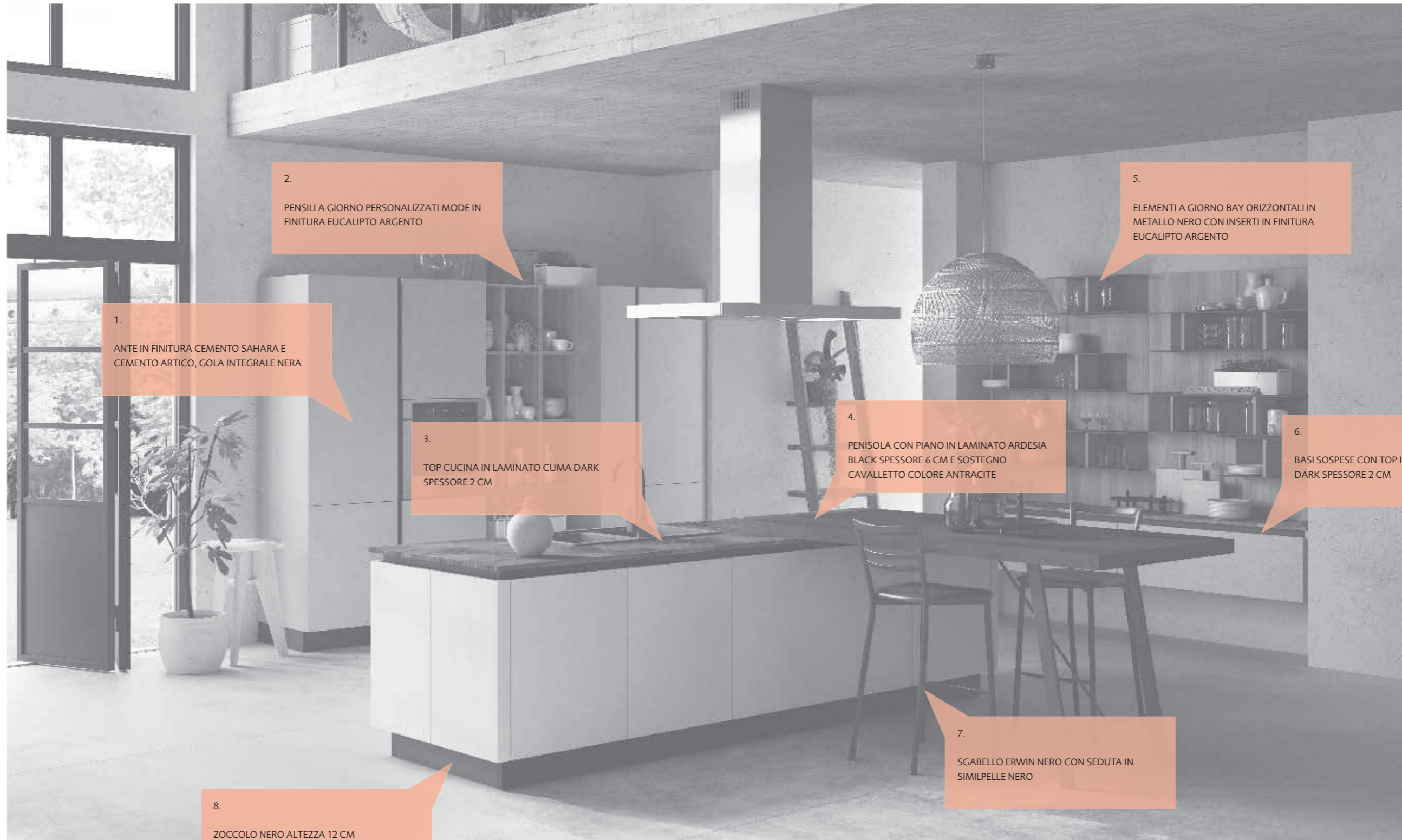
1. ANTE IN FINITURA CEMENTO SAHARA E CEMENTO ARTICO, GOLA INTEGRALE NERA