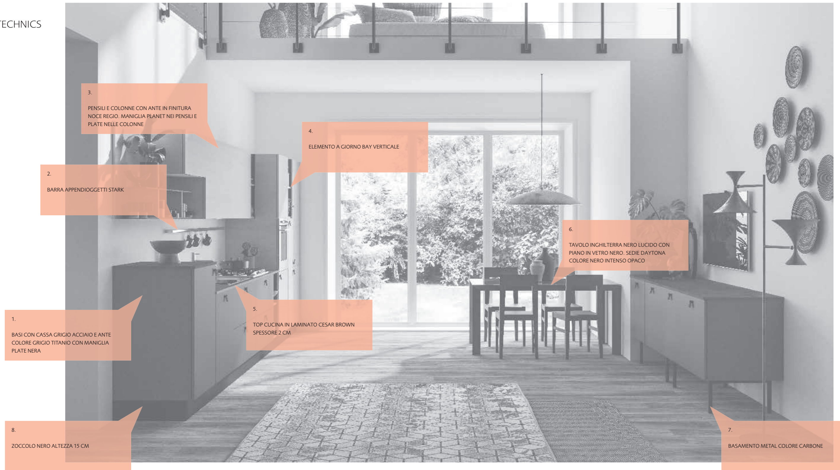
3. PENSILI E COLONNE CON ANTE IN FINITURA NOCE REGIO. MANIGLIA PLANET NEI PENSILI E PLATE NELLE COLONNE