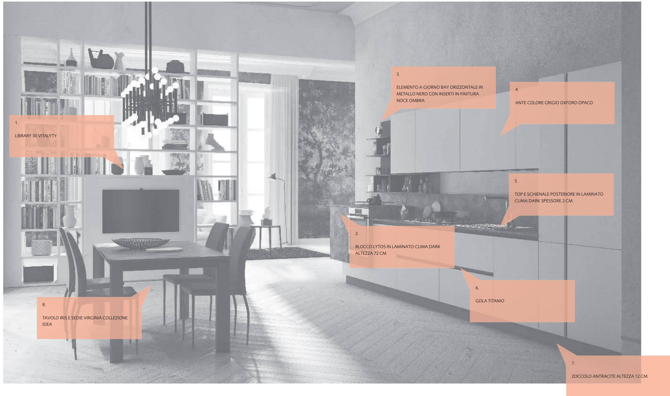
1. LIBRARY 30 VITALYTY