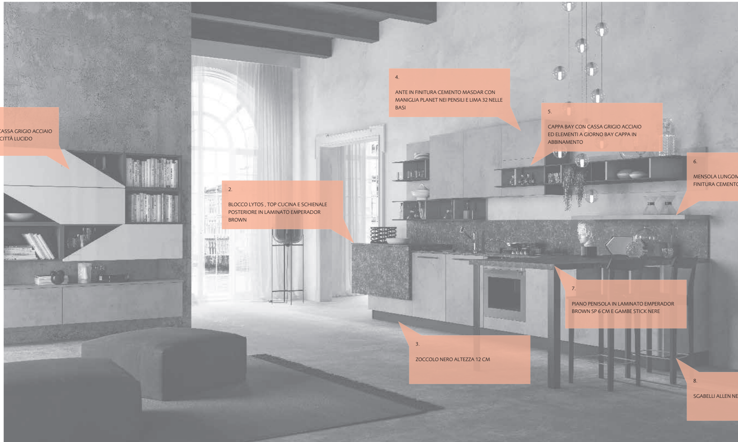
1. PENSILI TRAPEZIO CON CASSA GRIGIO ACCIAIO E ANTE COLORE GRIGIO CITTÀ LUCIDO