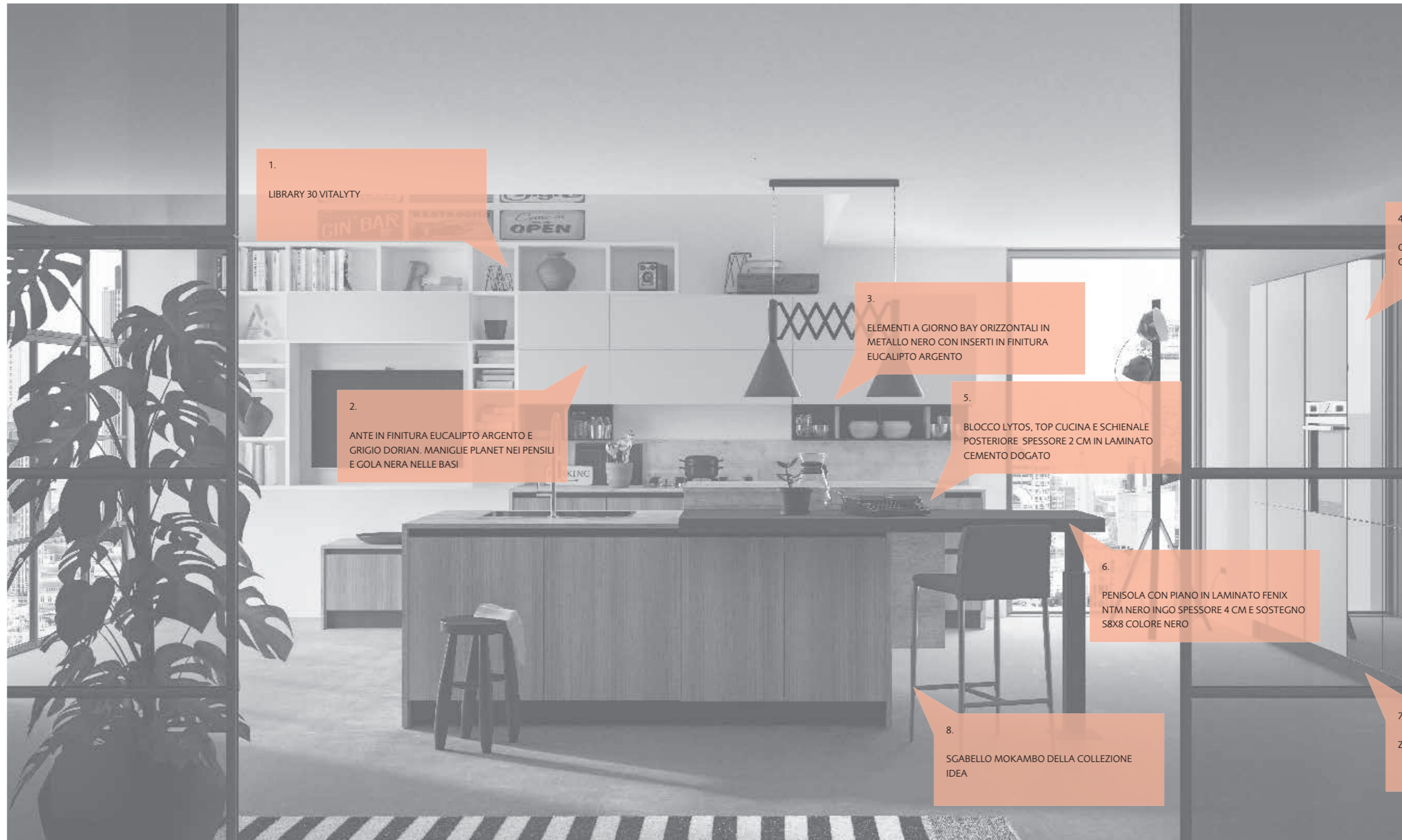
1. LIBRARY 30 VITALYTY