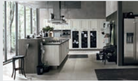
2 composition page 18