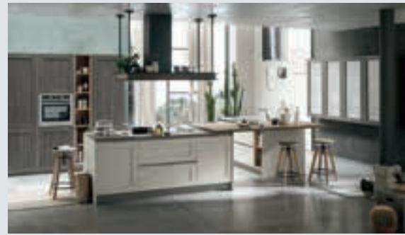
1 composition page 6