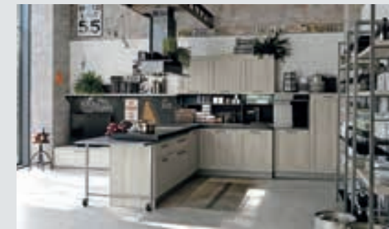
8 composition page 48