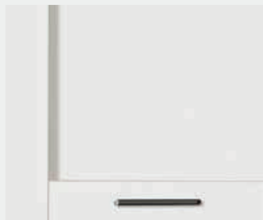
Pet bianco assoluto opaco