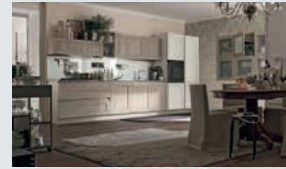
11 composition page 72