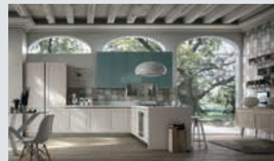
6 composition page 40