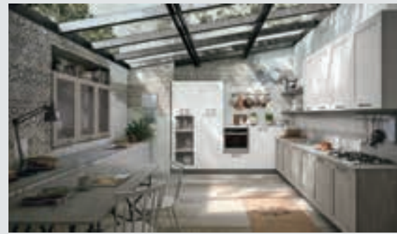
5 composition page 36