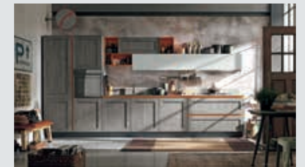
10 composition page 66