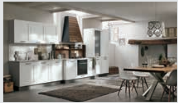
4 composition page 28