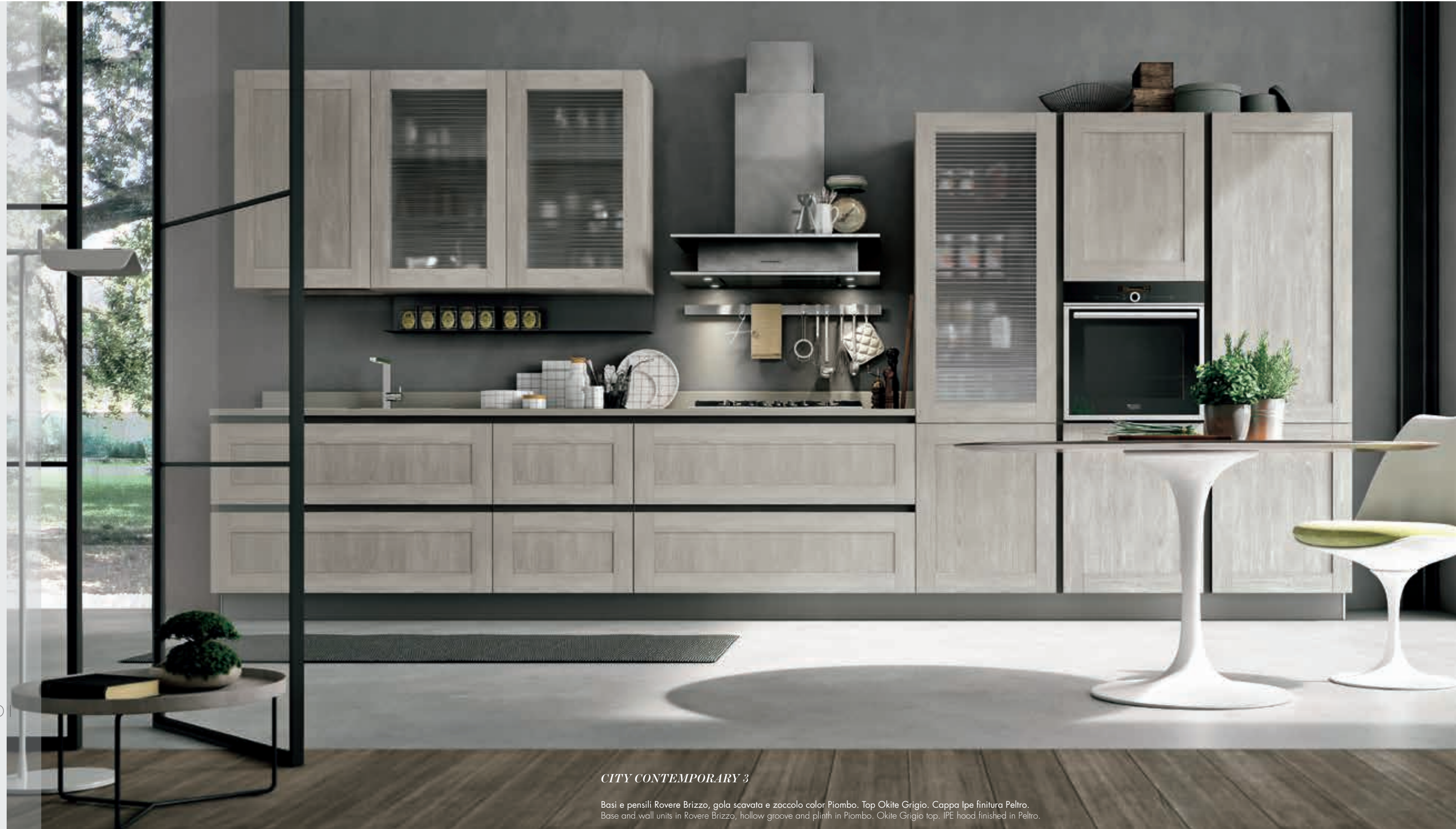
CITY CONTEMPORARY 3

THE LINEAR VERSION OF CITY IS EASILY RECONISABLE. ITS CHARM IS MAINTAINED IN THE PLAY ON VOLUME CREATED BY THE IPE HOOD AND ONDULINA GLASS DOORS WITH THEIR UNIQUE SATIN EFFECT.