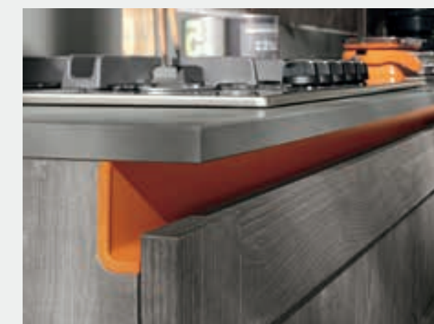
GOLA SCAVATA disponibile in 10 colori. HOLLOW GROOVE available in 10 colors.