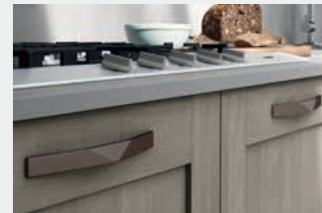
MRTF Rame Nero Satinato MRTG Nichel Nero Satinato