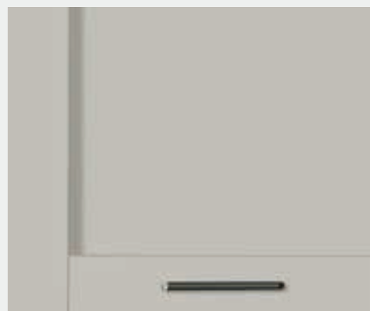
Pet cachemere opaco