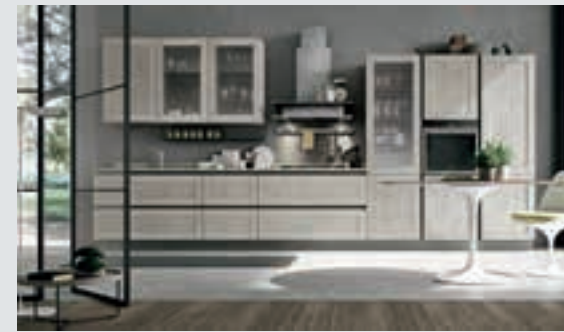
3 composition page 24