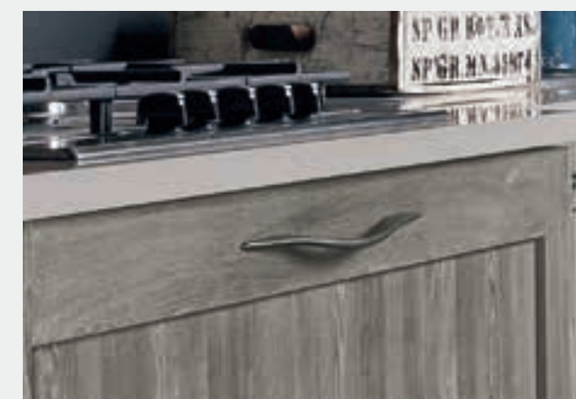
MVAB Bronzo titanio