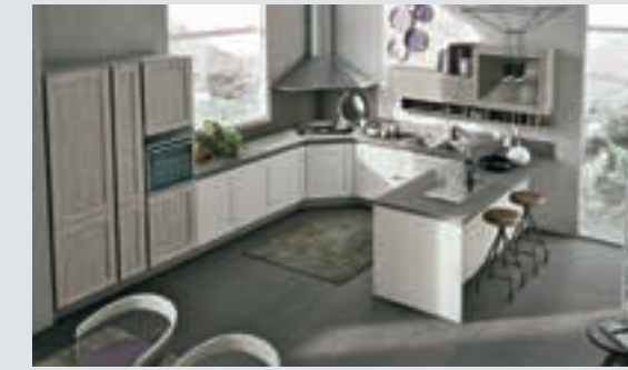
12 composition page 78