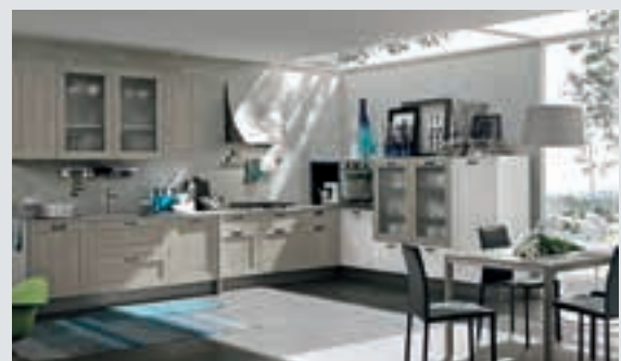
7 composition page 42