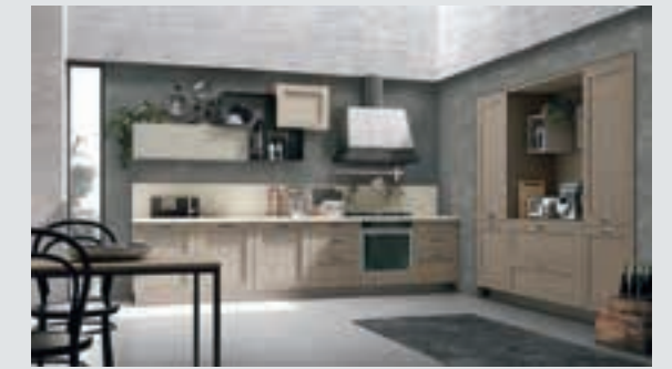
13 composition page 82