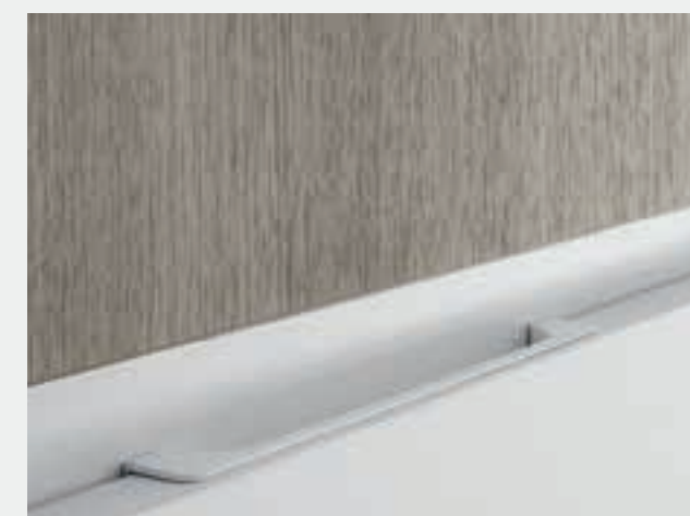
GOLA PIATTA CON TASCA disponibile in 5 colori. FLAT GROOVE WITH POCKET Available in 5 colors.