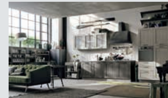
9 composition page 58